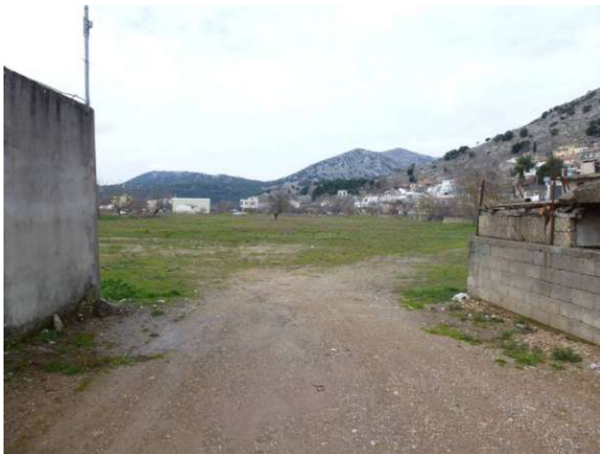
Εικόνα 3: ΑΠΟΨΗ ΟΙΚΟΠΕΔΟΥ