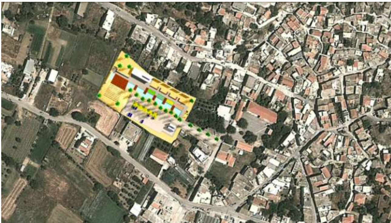
Εικόνα 1: ΑΠΟΨΗ ΟΙΚΟΠΕΔΟΥ ΑΠΟ GOOGLE

Το Θεματικό Πάρκο Οροπεδίου θα έχει καθαρά παιδαγωγικό χαρακτήρα με έμφαση στην περιβαλλοντική εκπαίδευση – ευαισθητοποίηση των κατοίκων (κύρια των παιδιών) αλλά και των επισκεπτών σε ζητήματα που σχετίζονται με τις παραδοσιακές παραγωγικές δραστηριότητες του Οροπεδίου και την διαχρονική τους σχέση με τις τοπικές διατροφικές συνήθειες. Η επίσκεψη σε αυτό θα γίνεται προγραμματισμένα χρονικά από μεμονωμένους ή ομάδες επισκεπτών στα πλαίσια της στρατηγικής του δήμου Οροπεδίου για ανάπτυξη φιλοπεριβαλλοντικών πολιτικών που στοχεύουν στην προβολή των διαχρονικών αξιών και συγκριτικών πλεονεκτημάτων του τόπου.