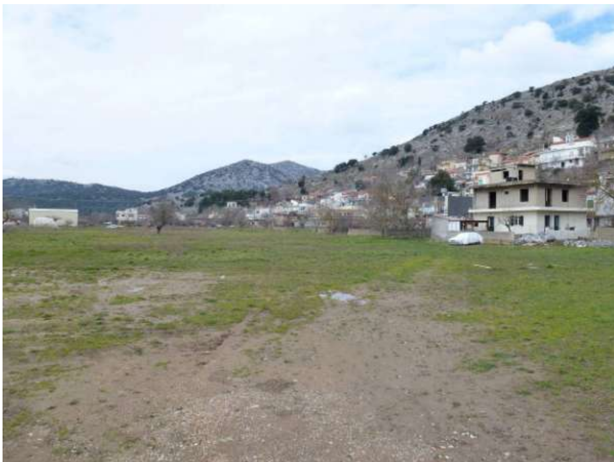
Εικόνα 2: ΑΠΟΨΗ ΟΙΚΟΠΕΔΟΥ